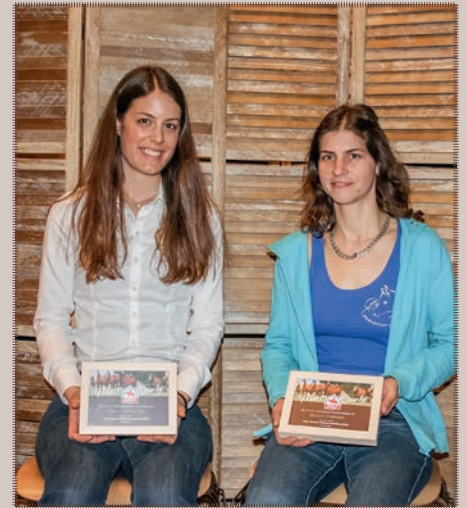
Schon seit 20 Jahren dabei.....