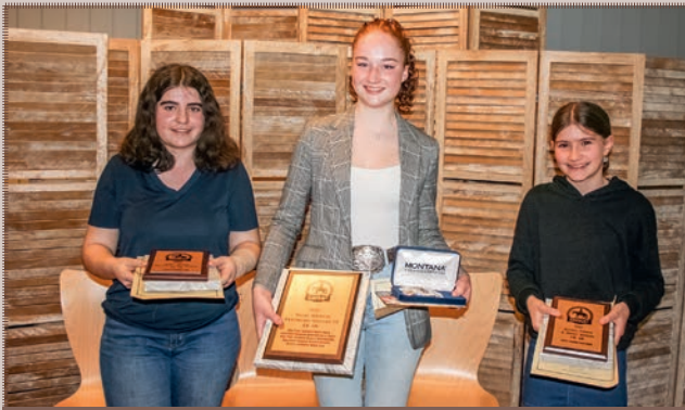
Highpoint Champions LK 4B