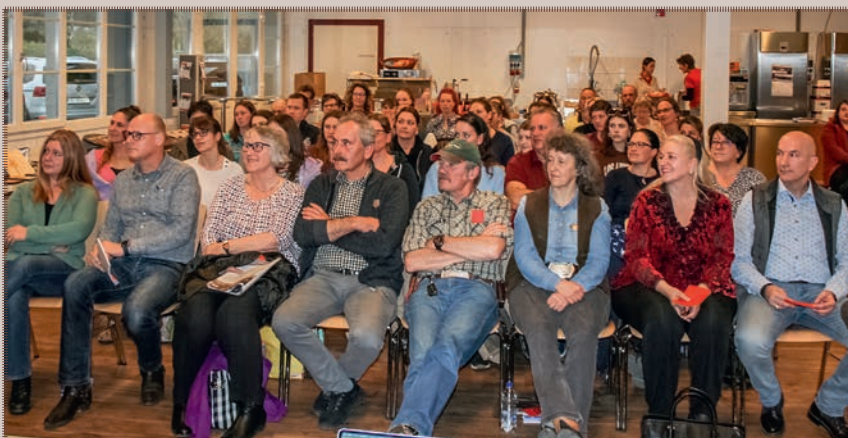
Es waren 101 Personen an der GV der SWRA 2023