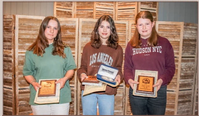
Highpoint Champions LK 2B