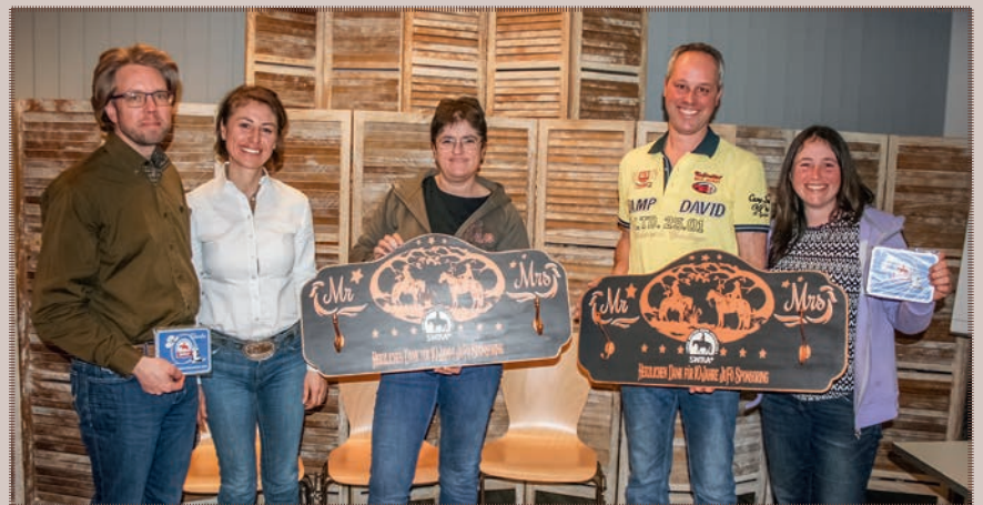
Vielen Dank für die Unterstützung der Jugendförderung!