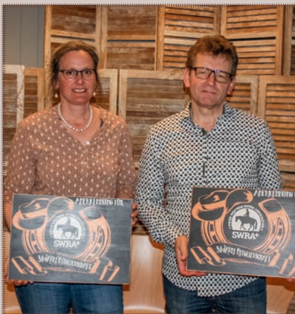
...und schon seit 30 Jahren dabei