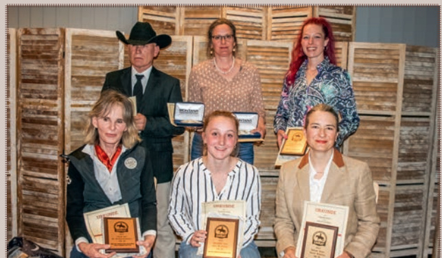
Highpoint Champions LK 1A