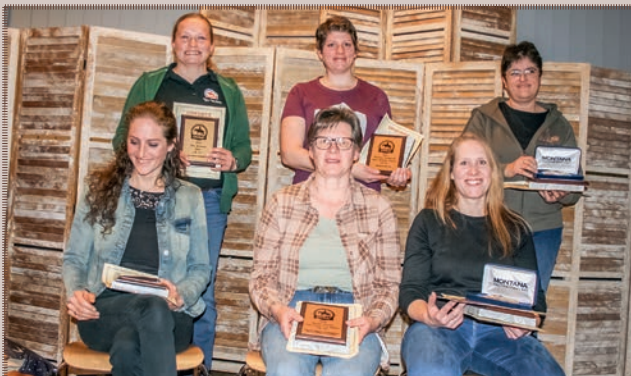
Highpoint Champions LK 4A