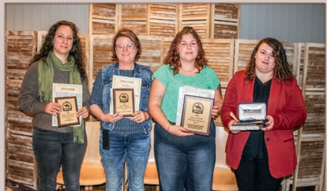
Highpoint Champions LK 3A