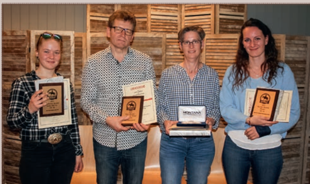
Highpoint Champions LK 2A