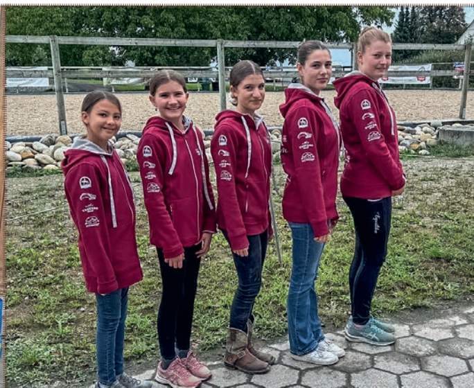
Unsere Jugendförderung war am Wochenende fleissig am Kuchen verkaufen in den neuen Jacken!