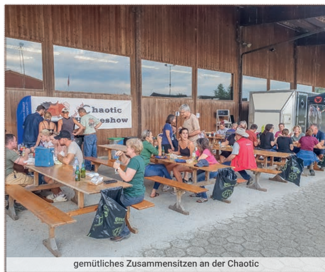
gemütliches Zusammensitzen an der Chaotic