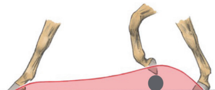
Der Hufhubbogen in einem Vorderbein, das den Huf zeigt, ist in der ersten Phase des Schritts am höchsten

Da sich die Hufe, bzw. die Beine nicht gradlinig bewegen macht es Sinn, wenn das Pferd in einem bestimmten Abstand vor der Stange abfusst, um diese nicht zu berühren.