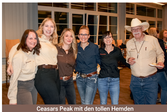
Ceasars Peak mit den tollen Hemden