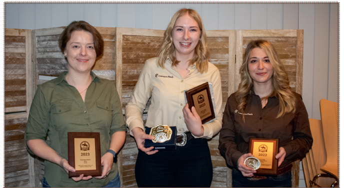
Highpoint Champions LK 4A