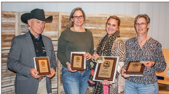
Highpoint Champions LK 1A