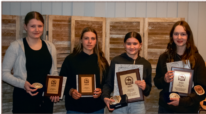
Highpoint Champions LK 2B und 4B