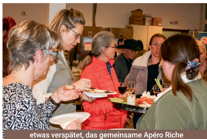
etwas verspätet, das gemeinsame Apéro Riche