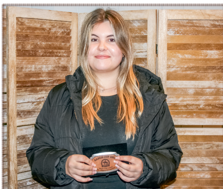
Ranch Cup Stufe 2 Jugend