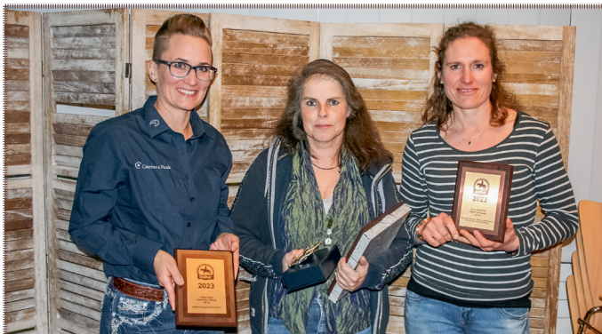
Highpoint Champions LK 3A