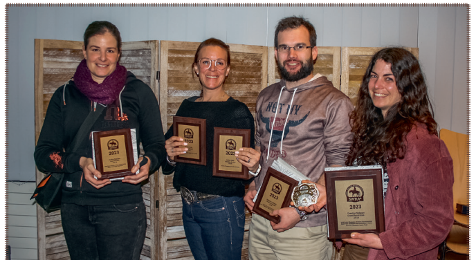
Highpoint Champions LK 2A