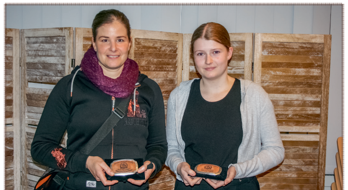
Ranch Cup Stufe 2 Jugend